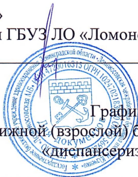
График на ДЕКАБРЬ 2025г передвижной (взрослой) бригады для профилактических осмотров «диспансеризации» взрослого населения.