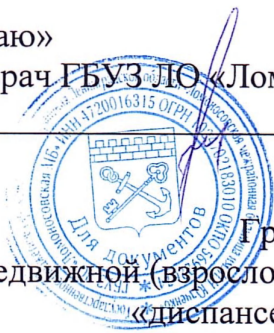
График на АПРЕЛЬ 2025г передвижной (взрослой) бригады для профилактических осмотров «диспансеризации» взрослого населения.