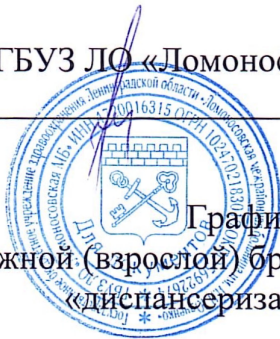
График на ИЮНЬ 2025г передвижной (взрослой) бригады для профилактических осмотров «диспансеризации» взрослого населения.