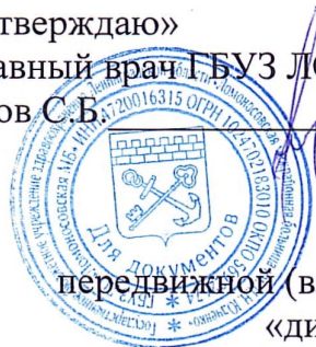
График на СЕНТЯБРЬ 2025г передвижной (взрослой) бригады для профилактических осмотров «диспансеризации» взрослого населения.

«Утверждаю» Главный врач ГБУЗ ЛО «Ломоносовская МБ» Усов С.Б.