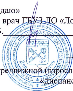
График на НОЯБРЬ 2025г передвижной (взрослой) бригады для профилактических осмотров «диспансеризации» взрослого населения.

«Утверждаю» Главный врач ГБУЗ ДО «Ломоносовская МБ» Усов С.Б.