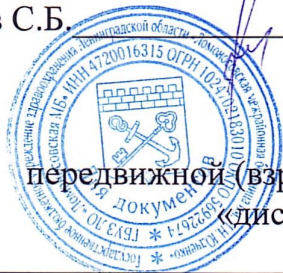
График на МАЙ 2025г передвижной (взрослой) бригады для профилактических осмотров «диспансеризации» взрослого населения.

«Утверждаю» Главный врач ГБУЗ ЛО «Ломоносовская МБ» Усов С.Б.