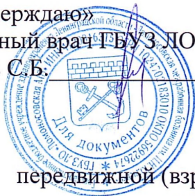
График на ОКТЯБРЬ 2025г передвижной (взрослой) бригады для профилактических осмотров «диспансеризации» взрослого населения.

«Утверждаю» Главный врач ГБУЗ ЛО «Ломоносовская МБ» Усов С.Б.