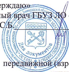
График на АВГУСТ 2025г передвижной (взрослой) бригады для профилактических осмотров «диспансеризации» взрослого населения.

«Утверждаю» Главный врач ГБУЗ ЛО «Ломоносовская МБ» Усов С.В.